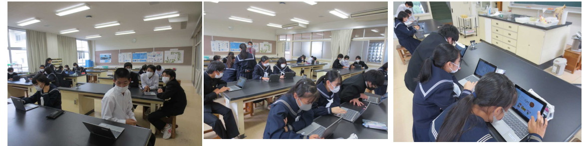
実行委員の皆さんが活動している様子