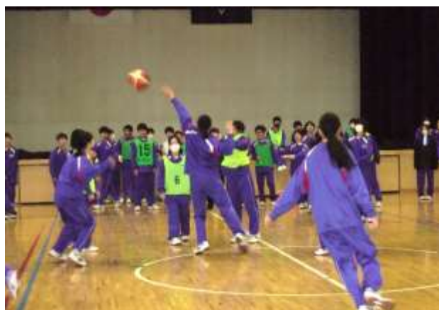
バスケットボール