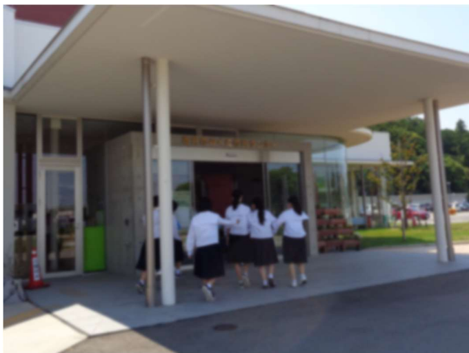
↑徒歩で、みくに未来ホールまで行きました。