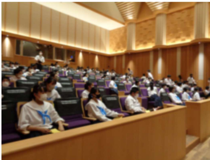
↑開演前の様子です。